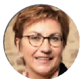
Iris Hotfilter Sparkassenakademie Nordrhein-Westfalen

0231 22240-789 barbara.doerr-lappe@ska.nrw