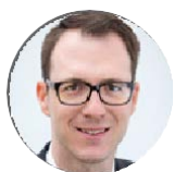
Sascha Winter Akademie der Sparkassen-Finanzgruppe Saar

06131 145-385 regine.schreiter@sv-rlp.de